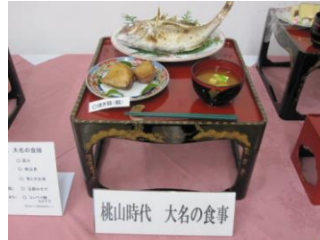
桃山時代の食事・江戸時代の食事